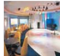
カラオケ「タイムカプセル」