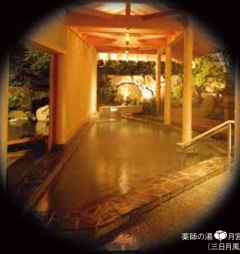
薬師の湯 ● 月宮殿 (三日月風呂)