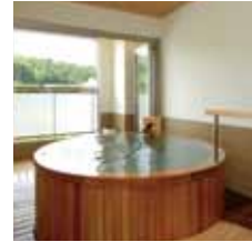
桜鏡(さくらかがみ)

ご家族やお友達、大切な方とプライベートな空間で温泉をお愉しみいただけます。癒しのひとときをゆつたりとお過ごしください。