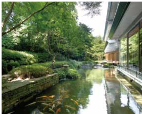
ティーラウンジより 庭園をのぞむ