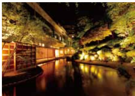
ライトアップされた庭園