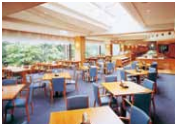
ダイニングレストラン「岩清水」