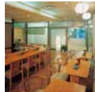
中華コーナー「桃園」